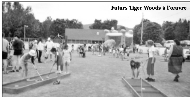
Futurs Tiger Woods à l'œuvre

L'après-midi du 24 juin a été bien animé sur le site du terrain des loisirs. Sur place, des activités variées étaient offertes aux familles et à tous les visiteurs : une structure gonflable, un mini-golf 9 trous, deux spectacles pour enfants et une vente de hot dogs et de rafraîchissements ont permis à tous de bien s'amuser.